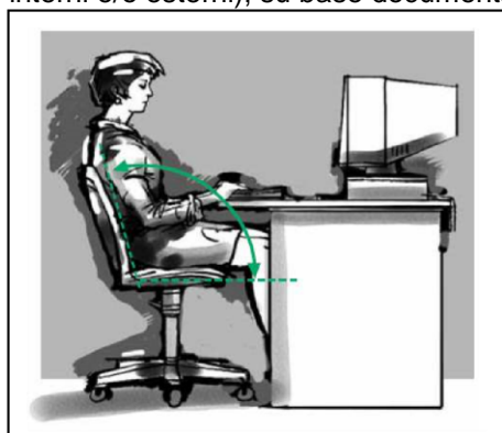
Postazione di lavoro corretta al videoterminale: la schiena è leggermente inclinata -INAIL 2010

Il controllo da parte dell'ATS sarà effettuato dal SPP e dal MC (se necessario con supporti tecnici specialistici, interni e/o esterni), su base documentale (trasmessa dal telelavoratore) e in fase di sopralluogo concordato.